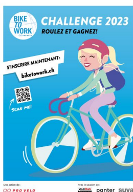
Affiche du challenge bike to work 2022.

Le changement de pratiques dans le domaine de la mobilité implique de connaître les possibilités offertes par un mode de transport, et d'avoir envie de l'utiliser. Les actions de promotion visent à éveiller cet intérêt.