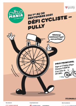
Affiche du challenge Cyclomania 2021.