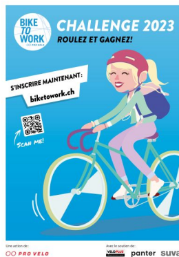
Plakat der bike to work Challenge 2022.

Eine Änderung des Mobilitätsverhaltens setzt voraus, die Möglichkeiten eines Verkehrsmittels zu kennen und Lust zu haben, es zu benutzen. Förderaktionen zielen darauf ab, dieses Interesse zu wecken.