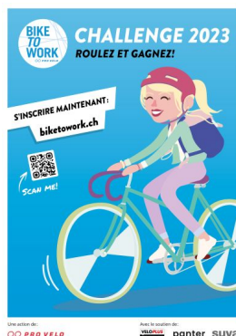
Plakat der bike to work Challenge 2022.

Eine Änderung des Mobilitätsverhaltens setzt voraus, die Möglichkeiten eines Verkehrsmittels zu kennen und Lust zu haben, es zu benutzen. Förderaktionen zielen darauf ab, dieses Interesse zu wecken.