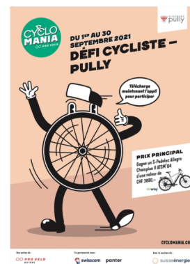
Plakat der Cyclomania Challenge 2021, Pully.