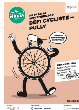
Plakat der Cyclomania Challenge 2021, Pully.