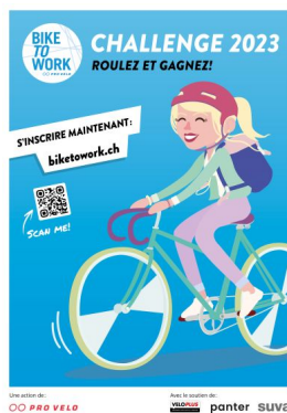
Plakat der bike to work Challenge 2022.

Eine Änderung des Mobilitätsverhaltens setzt voraus, die Möglichkeiten eines Verkehrsmittels zu kennen und Lust zu haben, es zu benutzen. Förderaktionen zielen darauf ab, dieses Interesse zu wecken.