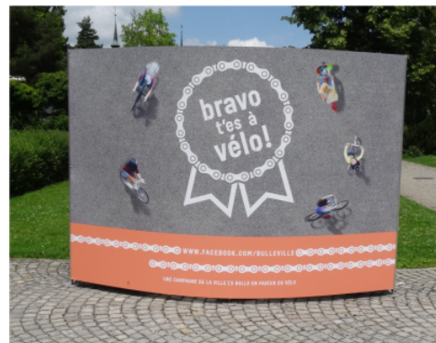
Campagne d'affichage à Bulle