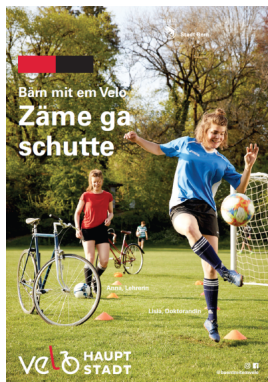
Campagne de communication de la ville de Berne

La réussite d'une campagne de communication tient à la maîtrise des outils marketing. Publics-cibles, canaux de communication et messages doivent être pensés de concert.