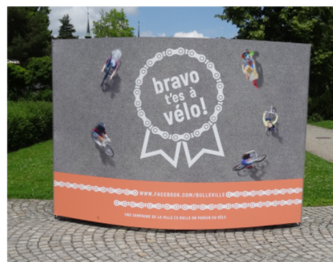
Campagne d'affichage à Bulle