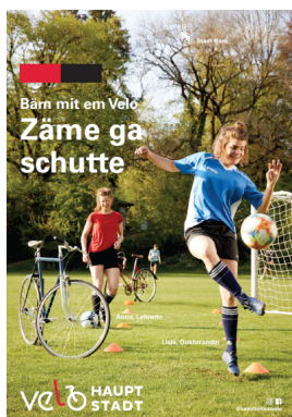
Campagne de communication de la ville de Berne

La réussite d'une campagne de communication tient à la maîtrise des outils marketing. Publics-cibles, canaux de communication et messages doivent être pensés de concert.