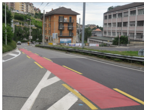
Roter Strassenbelag an einer Kreuzung, Neuenburg