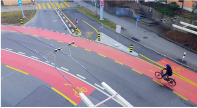
Roter Strassenbelag auf dem Bucheggplatz, Zürich