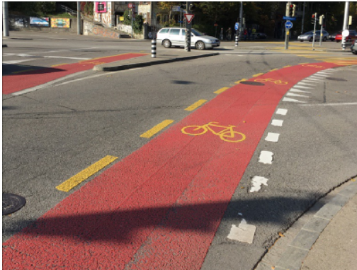
Roter Strassenbelag beim Henkerbrännli, Bern