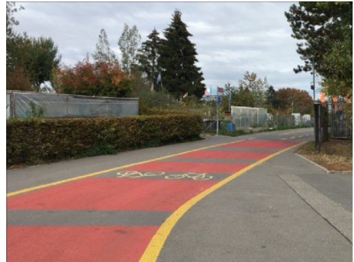
Roter Strassenbelag auf einem von Fussgänger:innen überquerten Radweg entlang dem Ladenwandweg, Bern.