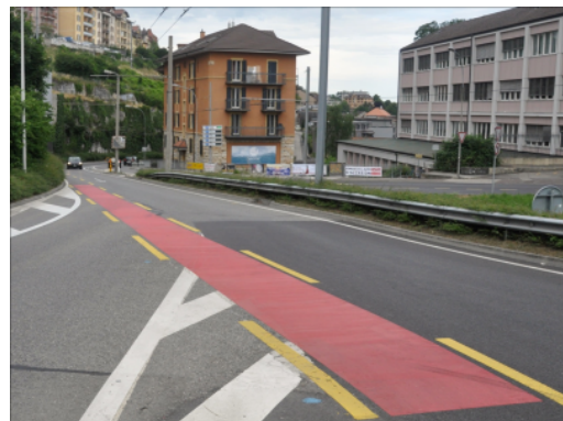
Roter Strassenbelag an einer Kreuzung, Neuenburg