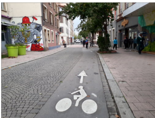
Geteerter Radstreifen auf einer gepflasterten Strasse, Strassburg

Die Instandhaltung von Velowegen sollte eine Priorität der Gemeinden sein, insbesondere im Winter (Schneeräumung).