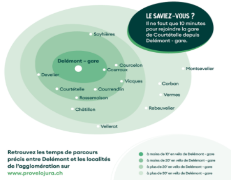
Karte der Fahrzeiten mit dem Velo ab dem Bahnhof Delémont.