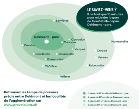
Karte der Fahrzeiten mit dem Velo ab dem Bahnhof Delémont.