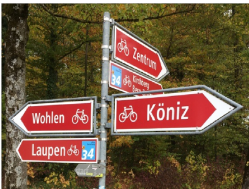
Beschilderung für Alltagsziele und Freizeitroutes von SchweizMobil, Bern

Eine grosse Herausforderung bei der Wegweisung für den Veloverkehr besteht in ihrer guten Integration in den räumlichen Kontext. Es geht insbesondere darum, darauf zu achten, dass sich die Signalisation ergänzt (regionale, lokale und übergeordnete Strassen-Wegweisung) und doppelte Informationen vermieden werden. Auch das richtige Mass an Wegweisung muss gefunden werden: Zu viele Schilder sorgen für Verwirrung, zu wenige Schilder für Unsicherheit. Die Standorte müssen sorgfältig ausgewählt werden, hauptsächlich um sicherzustellen, dass sie gut sichtbar sind. Die Koordination zwischen Gemeinden und Kantonen ist ebenfalls wichtig, um die Kontinuität der Hinweise und die Kohärenz über die Grenzen hinaus zu gewährleisten. Eine weitere Herausforderung besteht im Unterhalt der Signalisation (regelmässige Kontrolle und klare Zuständigkeiten).