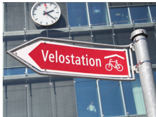
Beschilderung für die Velostation Bern Milchgässli