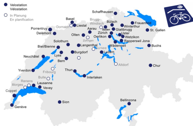
Localisation des vélostations en Suisse, état février 2022.