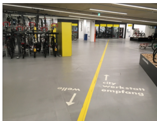
Vélostation PostParc à la gare de Berne