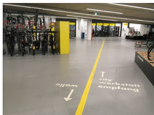
Vélostation PostParc à la gare de Berne