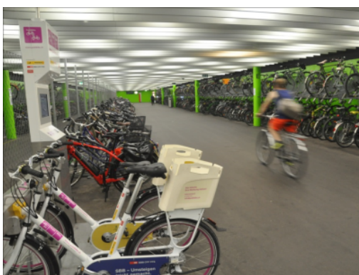
Vélostation à la gare de Soleure

L'emplacement et l'accès à la vélostation constituent ses enjeux principaux. Afin de garantir son attractivité, les accès (entrées et sorties) doivent éviter les conflits avec les autres usagers et usagères et ne pas obliger les cyclistes à descendre de leur vélo ou à faire des détours. Il est également recommandé de soigner la signalétique des accès. Comme pour les passages inférieurs, la largeur et la pente de la rampe ainsi que sa luminosité doivent faire l'objet d'une attention spécifique. De même, pour éviter un sentiment d'insécurité, un aménagement clair et sans recoins est à privilégier.