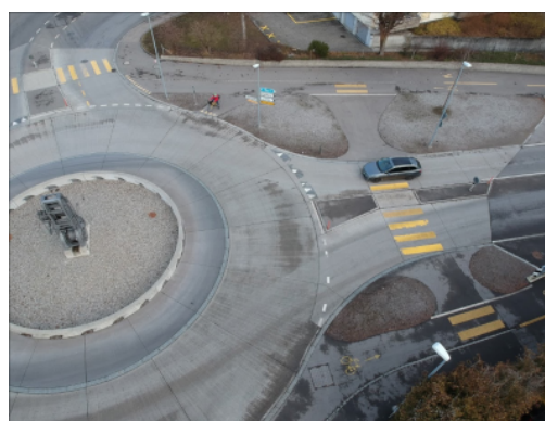
Schachenkreisel mit separaten Radwegen, Lyss