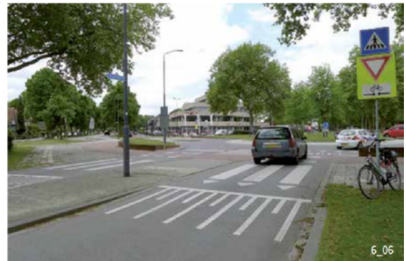
Vertikaler Absatz, mit dem die Geschwindigkeit der Autofahrenden bei der Einfahrt.