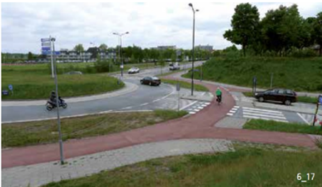
Getrennter Radweg mit Vortritt bei den Kreiseinfahrten in den Niederlanden.