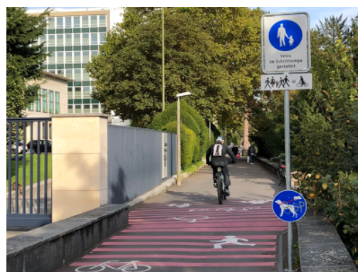
Chemin piéton autorisé aux cyclistes qui roulent au pas