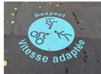
Campagne de sensibilisation pour la cohabitation entre piéton-ne-s, trottinettistes et cyclistes à Lausanne

Des pictogrammes marqués au sol peuvent rappeler aux usagers et usagères qu'un trottoir ou un chemin est partagé et qu'il convient de faire preuve d'égard envers les autres usagers et usagères.