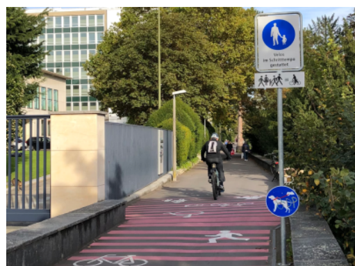
Chemin piéton autorisé aux cyclistes qui roulent au pas