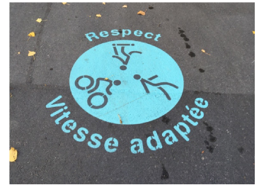
Campagne de sensibilisation pour la cohabitation entre piéton-ne-s, trottinettistes et cyclistes à Lausanne

Des pictogrammes marqués au sol peuvent rappeler aux usagers et usagères qu'un trottoir ou un chemin est partagé et qu'il convient de faire preuve d'égard envers les autres usagers et usagères.