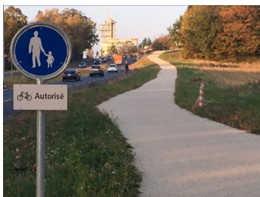
Chemin piéton autorisé aux cyclistes sur le campus de l'EPLF/Unil

Des surfaces partagées entre piéton-ne-s et cyclistes sont sujet à débat, puisqu'elles peuvent reporter le danger sur les piéton-ne-s, en particulier les plus fragiles (aînés, enfants, personnes à mobilité réduite). Afin d'assurer la meilleure cohabitation possible, la largeur du trottoir doit être considérée en fonction du contexte (flux, pente, décrochements, etc.). Des mesures de sensibilisation peuvent inciter au respect mutuel. La réinsertion des cyclistes sur la chaussée doit être aménagée finement (limiter les ralentissements liés à la perte de priorité du cycliste, visibilité entre usagers et usagères de la route). Enfin, une rue en pente constitue un contexte délicat pour la mise en place d'un trottoir partagé en raison d'un différentiel de vitesse élevé avec les piéton-ne-s (tous types de vélos à la descente et vélos à assistance électrique à la montée).