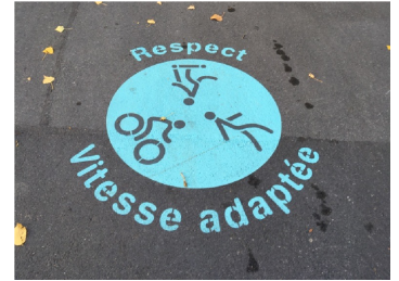
Campagne de sensibilisation pour la cohabitation entre piéton-ne-s, trottinettistes et cyclistes à Lausanne

Des pictogrammes marqués au sol peuvent rappeler aux usagers et usagères qu'un trottoir ou un chemin est partagé et qu'il convient de faire preuve d'égard envers les autres usagers et usagères.