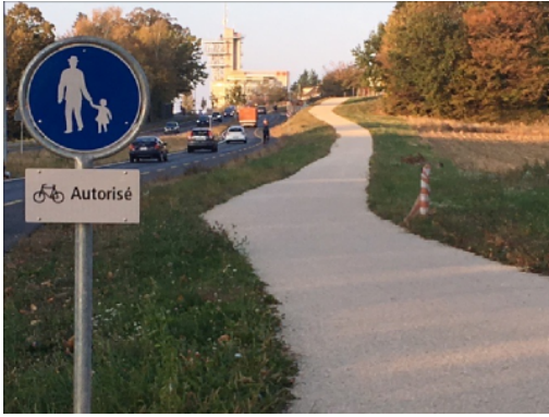
Fussweg auf dem Campus der UNIL/EPFL, Velos gestattet, Lausanne