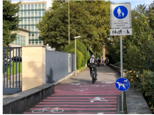
Fussweg in Basel mit Hinweis "Velos im Schrittempo gestattet"

Auf dem Boden markierte Piktogramme können die Nutzer:innen daran erinnern, dass der Weg gemeinsam genutzt wird und dass Rücksicht auf Andere genommen werden soll.