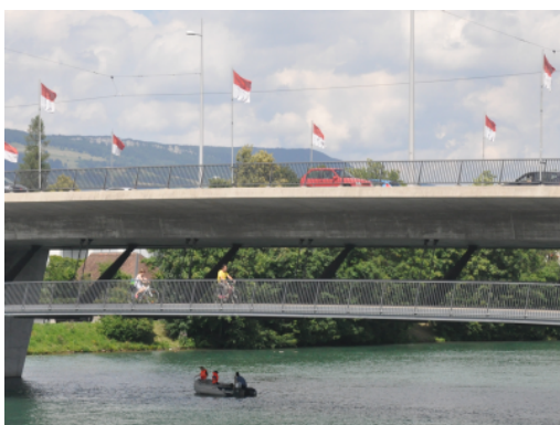
Passerelle à Soleure

Le choix du revêtement est important, tant en termes de facilité d'entretien qu'en termes de sécurité (risque de glissade ou de verglas). Les accès doivent être soignés : courbes plutôt qu'angles pour garantir une bonne visibilité, pentes praticables par tous les vélos (y compris ceux équipés d'une remorque), bonnes liaisons entre l'ouvrage d'art et le réseau cyclable. La conception de l'ouvrage doit permettre aux cyclistes de circuler sans mettre le pied à terre ou devoir pousser le vélo. Les coûts d'un ouvrage d'art sont généralement élevés. Toutefois, une passerelle peut devenir emblématique (geste architectural) et déclencher une prise de conscience de la place à accorder au vélo.