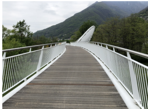
Passerelle à Locarno