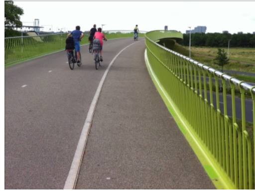
Passerelle au-dessus d'une autoroute, Pays-Bas

À Berne, un projet de passerelle pour piétons et cyclistes existe pour relier le quartier de Lorraine à celui de Länggasse. Cet ouvrage permettrait d'éviter des détours et combler une coupure topographique dans le réseau cyclable. Une association «Pro Panoramabrücke» a été créée en ce sens.