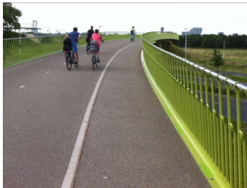
Passerelle au-dessus d'une autoroute, Pays-Bas

À Berne, un projet de passerelle pour piétons et cyclistes existe pour relier le quartier de Lorraine à celui de Länggasse. Cet ouvrage permettrait d'éviter des détours et combler une coupure topographique dans le réseau cyclable. Une association «Pro Panoramabrücke» a été créée en ce sens.