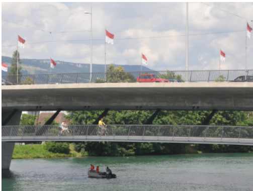
Passerelle à Soleure

Le choix du revêtement est important, tant en termes de facilité d'entretien qu'en termes de sécurité (risque de glissade ou de verglas). Les accès doivent être soignés : courbes plutôt qu'angles pour garantir une bonne visibilité, pentes praticables par tous les vélos (y compris ceux équipés d'une remorque), bonnes liaisons entre l'ouvrage d'art et le réseau cyclable. La conception de l'ouvrage doit permettre aux cyclistes de circuler sans mettre le pied à terre ou devoir pousser le vélo. Les coûts d'un ouvrage d'art sont généralement élevés. Toutefois, une passerelle peut devenir emblématique (geste architectural) et déclencher une prise de conscience de la place à accorder au vélo.