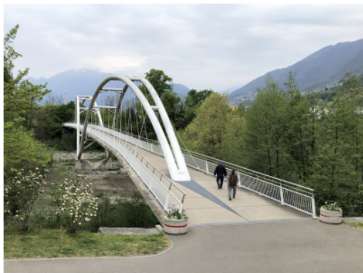
Passerelle à Monte Carasso