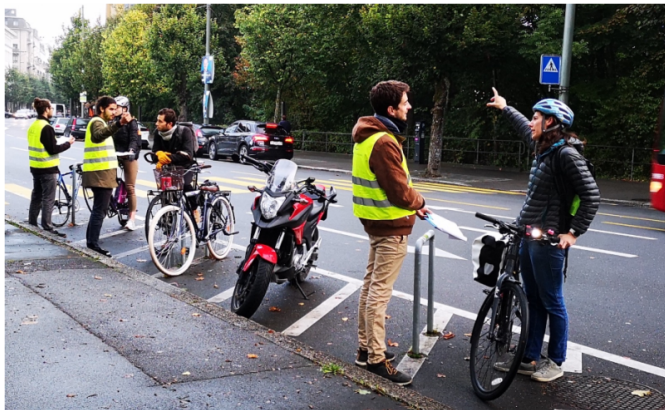
Intercept surveys réalisés par l'OUVEMA dans le cadre de l'évaluation d'un aménagement cyclable sur le boulevard de Pérolles à Fribourg (Schmassmann & Rérat 2023)