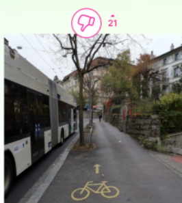
Exemple d'un point problématique identifié à Lausanne.

Vraiment ? Vous appelez ça une piste cyclable ??