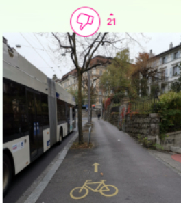
Beispiel für einen identifizierten Problempunkt, Lausanne.

Vraiment ? Vous appelez ça une piste cyclable ??