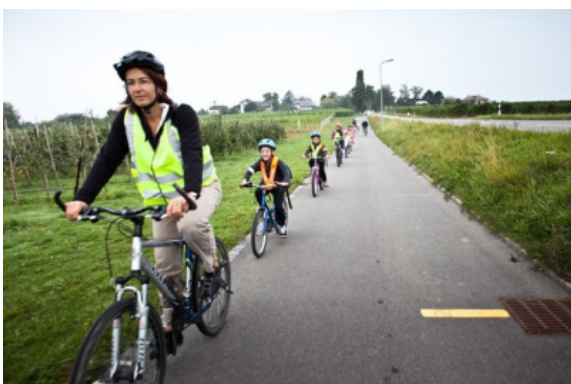
Schüler:innen, die mit dem Velo-Bus zur Schule fahren.

Der Erfolg dieser Aktionen hängt von der Bereitschaft der Lehrpersonen und der Schulleitungen ab, sie in ihre schulischen Aktivitäten aufzunehmen. Ein positives Image des Velos in den Schulen, verschiedene Aktivitäten aber auch die angebotene Veloparkierung fördern die Nutzung des Velos für den Schulweg. Lehrpersonen können auch als Vorbilder für die Schüler:innen fungieren, indem sie selbst Velo fahren.