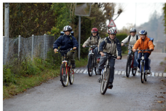
Schüler:innen mit dem Velo auf dem Schulweg.