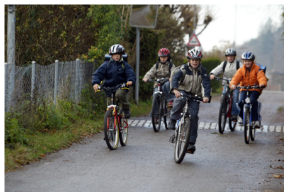
Schüler:innen mit dem Velo auf dem Schulweg.