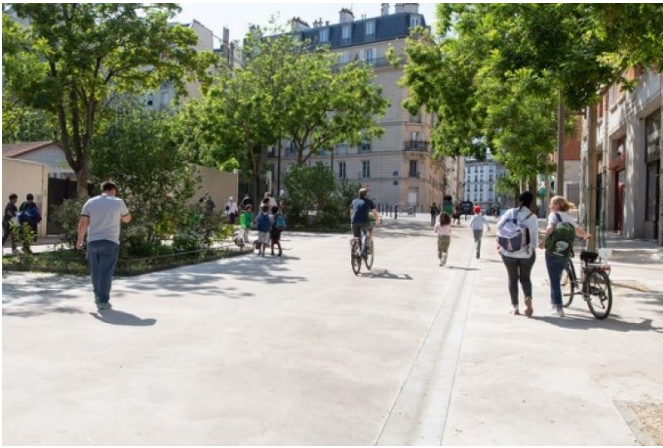
Beispiel einer Schulstrasse am Boulevard Murat im 16. Arrondissement in Paris.

Die Plattform Schule+Velo , eine Initiative von Pro Velo Schweiz und Swiss Cycling, vereint Initiativen zur Förderung des Velofahrens in der Schule. Die Aktivitäten richten sich an Schüler:innen im Alter von 6 bis 20 Jahren. Die Plattform bietet Velo-Kurse, Unterrichtsmaterial, Wettbewerbe und Leitfäden an und Wettbewerbe an, um eine velofreundliche Schule zu gestalten. Im Leitfaden der Allianz Schule+Velo finden sich weitere Informationen und direkt buchbare Angebote für Schulen.