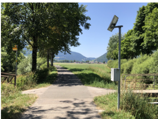
Feldweg auf einer SchweizMobil-Veloroute im Val de Travers mit Velo-Zählstelle

Die Anwesenheit von landwirtschaftlichen Fahrzeugen stellt für Velofahrer:innen ein Sicherheitsrisiko dar. Sie müssen manchmal langsamer fahren oder auf dem Seitenstreifen anhalten, um einen Traktor zu kreuzen. Auch der Koexistenz mit Spazierenden und Reitenden muss Rechnung getragen werden. Zudem sind landwirtschaftliche Wege im Kontext des Veloroutennetzes oft auch nicht die direktesten Wege, Umwege sind keine Seltenheit. Die regelmässige Instandhaltung dieser Wege – die häufig durch landwirtschaftliche Aktivitäten verschmutzt werden – ist zentral und muss zwischen den verschiedenen Akteur:innen (Behörden, Landwirt:innen) geregelt werden. Es wird empfohlen, das Wegerecht mit den Landbesitzer:innen auszuhandeln, um die Erhaltung der Route zu sichern. Schliesslich ist der Nutzen dieser Routen je nach Jahreszeit begrenzt, vor allem wegen fehlender Schneeräumung oder Beleuchtung.