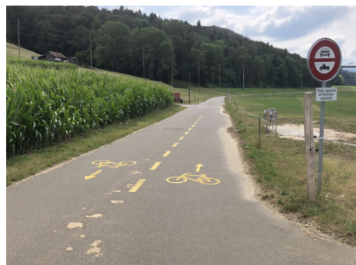
Feldweg mit Velo-Signalisation in Courtedoux im Kanton Jura