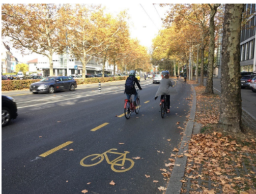
Bande cyclable large sur la "Velohauptroute" au Nordring à Berne, qui permet aux cyclistes de dépasser sans quitter la bande cyclable

Sans potelets, une bande cyclable n'offre qu'une séparation visuelle de l'espace destiné aux cyclistes. La sécurité – objective et subjective – est alors insuffisante en cas de charges et de vitesses élevées du trafic motorisé. Une attention particulière doit être accordée lorsque la bande cyclable longe du stationnement et lorsqu'elle s'interrompt (arrêt de bus, passages étroits, passages piétons, intersections, etc.). Ces situations péjorent fortement l'intérêt de ce type d'aménagement. Par ailleurs, il est important de faire respecter l'interdiction de stationnement sur les bandes cyclables (livraisons ou dépose-minute p.ex.).