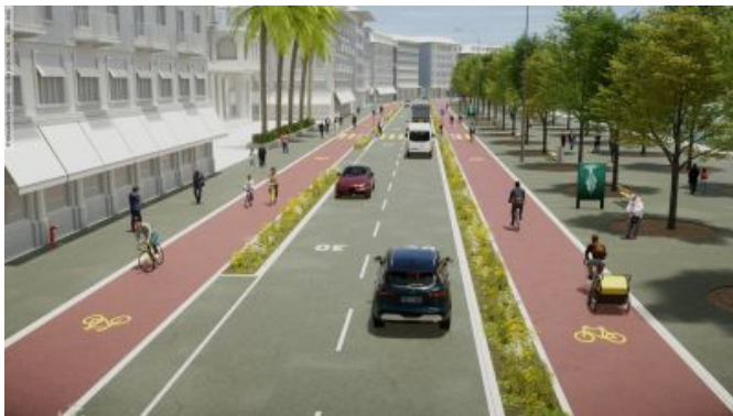
Illustrations de bandes cyclables sûres et attrayantes à l'intérieur des localités sur les axes principaux.