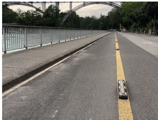
Exemple d'éléments de séparation pour sécuriser davantage la bande cyclable, ici à la Matte, Berne.

Si une bande cyclable* borde du stationnement longitudinal de voitures, un espace libre de 50 à 70 centimètres doit être maintenu afin de limiter le risque « coup de la portière ».