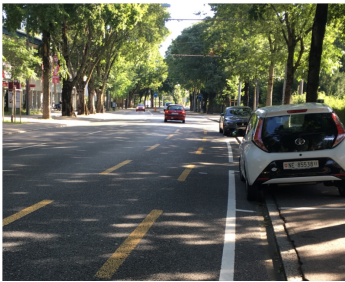
Bande cyclable laissant un espace de sécurité avec les véhicules parkés à Bienne

En Suisse, les normes VSS conseillent une largeur minimale de 1.50 m pour les bandes cyclables. Ces dernières doivent être élargies le long de murs, en cas de virage, de pente (dès 4%), de vitesses ou de charges de trafic élevées, et de fort trafic de vélos existant ou potentiel (en particulier en présence de nombreux vélos à assistance électrique). Cette largeur ne fait toutefois plus l'unanimité car elle est jugée inadaptée dans de nombreuses situations. Plusieurs villes ou cantons comme Berne ou Zurich favorisent ainsi des largeurs plus importantes afin d'offrir davantage de sécurité et de place aux cyclistes.