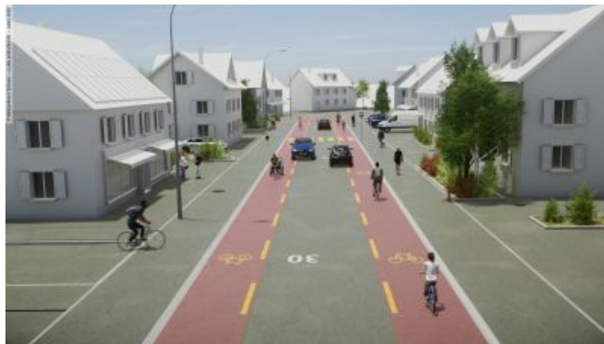
Illustration de bandes cyclables sûres et attrayantes sur les traversées de localités étroites.