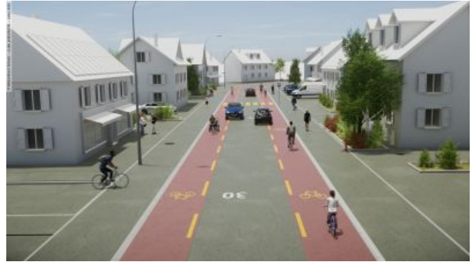
Illustration de bandes cyclables sûres et attrayantes sur les traversées de localités étroites.