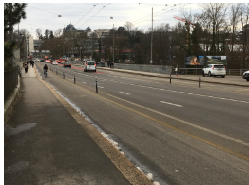
Bande cyclable avec potelets sur la Lorrainebrücke à Berne